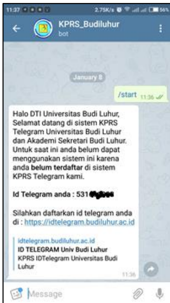
Gambar 4 – Perintah /start