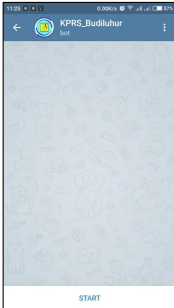
Gambar 3 – Tombol start Telegram