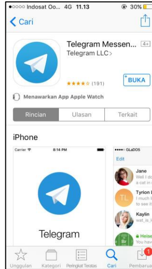
Gambar 2 - Telegram (AppStore)